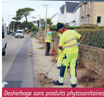
Desherbage sans produits phytosanitaires