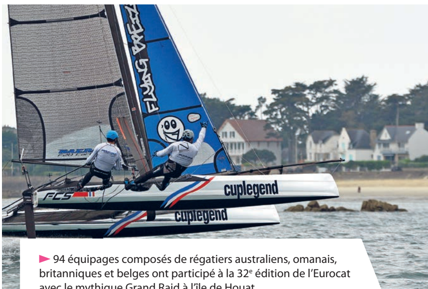
► 94 équipages composés de régatiers australiens, omanais, britanniques et belges ont participé à la 32 e édition de l'Eurocat avec le mythique Grand Raid à l'île de Houat.