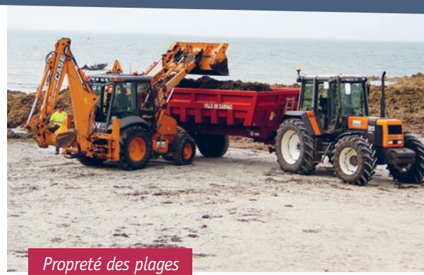
Propreté des plages