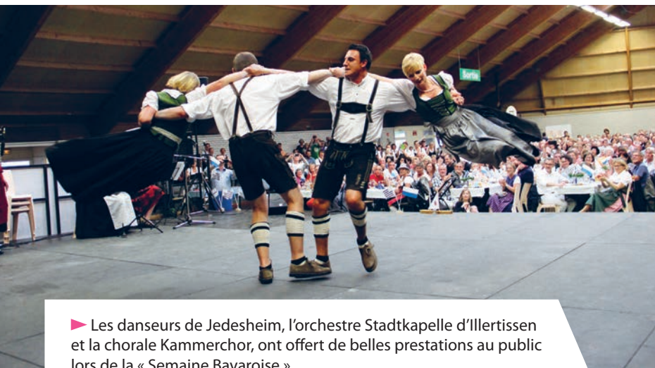
► Les danseurs de Jedesheim, l'orchestre Stadtkapelle d'Illertissen et la chorale Kammerchor, ont offert de belles prestations au public lors de la « Semaine Bavaroise ».