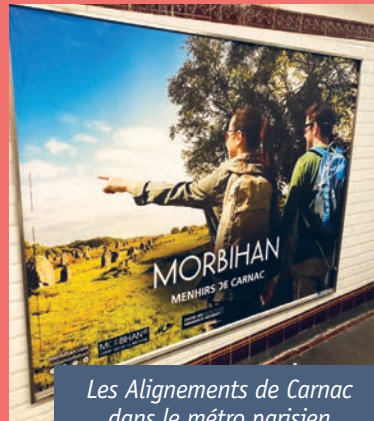
Les Alignements de Carnac dans le métro parisien

Notre commune a été mise en lumière par de nombreux médias tout au long de ce semestre. L'occasion de la (re) découvrir sous de multiples facettes.