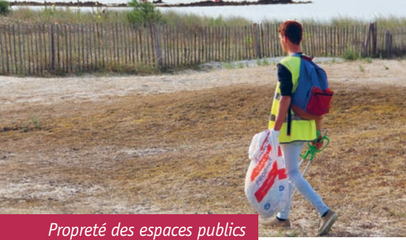
Propreté des espaces publics