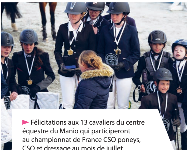
► Félicitations aux 13 cavaliers du centre équestre du Manio qui participeront au championnat de France CSO poneys, CSO et dressage au mois de juillet.