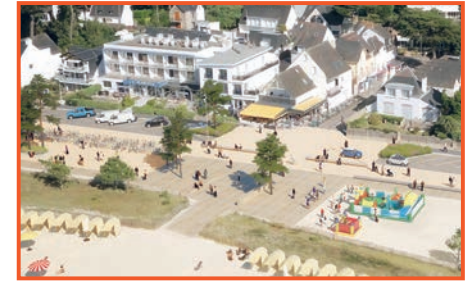
Future entrée de la Grande-Plage