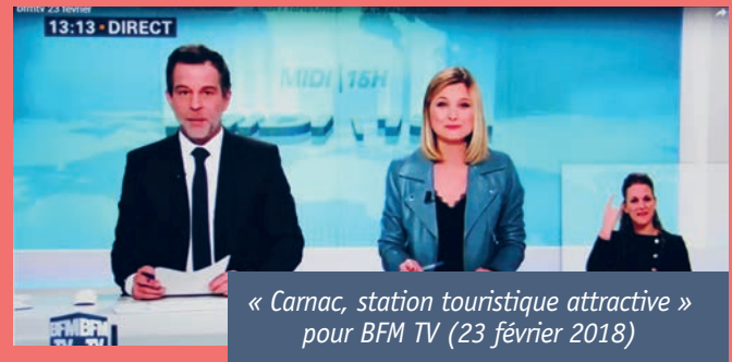
« Carnac, station touristique attractive » pour BFM TV (23 février 2018)