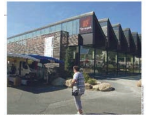
Ouverte en juillet 2016, la médiathèque de Carnac s'est dotée d'un espace Facile à lire.