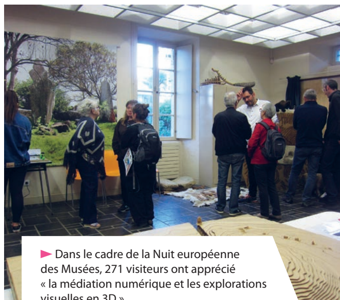
► Dans le cadre de la Nuit européenne des Musées, 271 visiteurs ont apprécié « la médiation numérique et les explorations visuelles en 3D ».