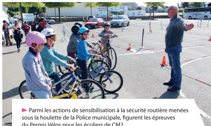
► Parmi les actions de sensibilisation à la sécurité routière menées sous la houlette de la Police municipale, figurent les épreuves du Permis Vélos pour les écoliers de CM2.