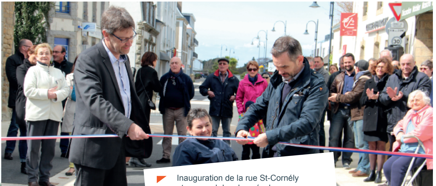
➤ Inauguration de la rue St-Cornély et carnaval des deux écoles.