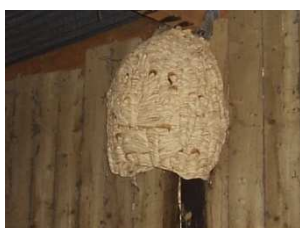
Nid de Frelon Européen