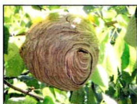
Nid de guêpes des buissons

Le Frelon Européen construit également un nid, mais qui est ouvert en partie inférieure. Il installe son nid préférentiellement dans le tronc des arbres creux, dans les bâtiments, rarement en partie aérienne.