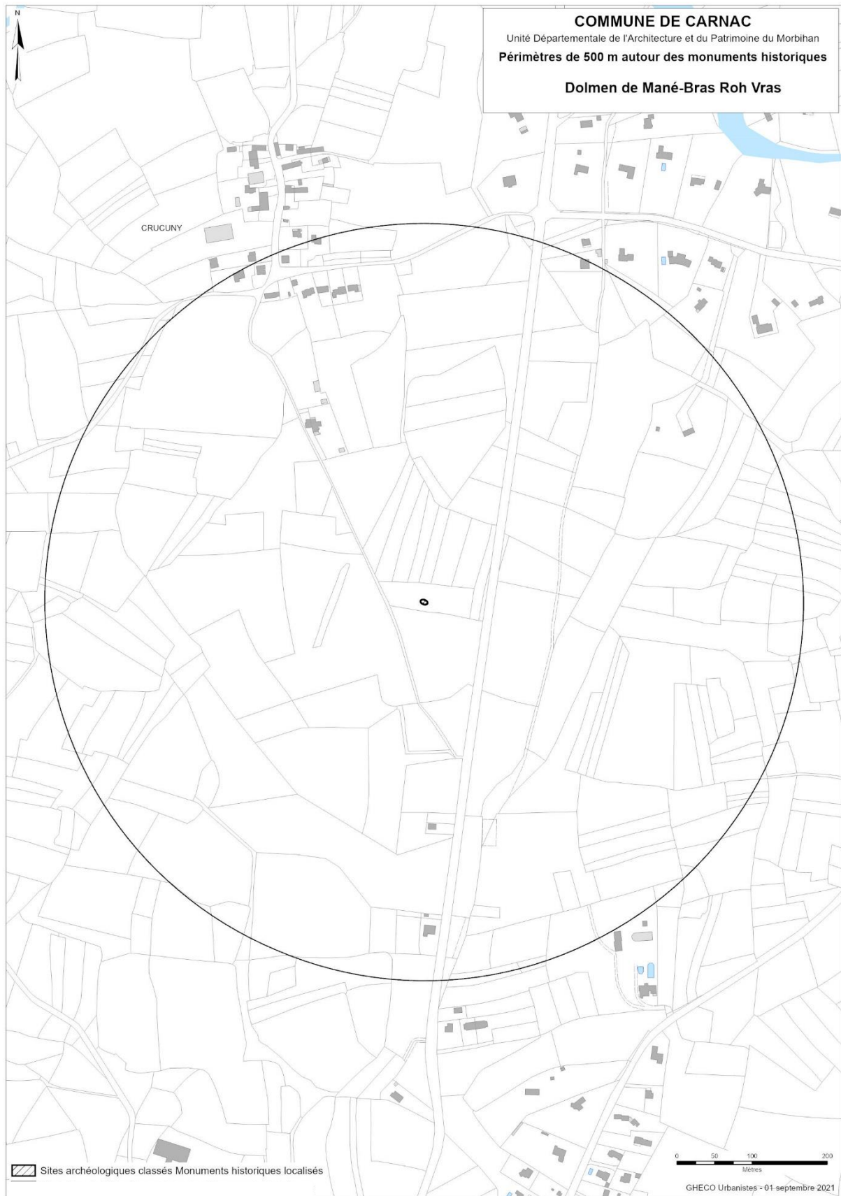
Localisation du MH et de son périmètre de 500 m